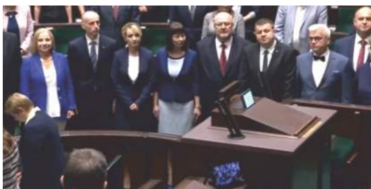
■ W dniu 12 czerwca 2019 r. wypowiedzianą rotą przysięgi rozpocząłem poselską służbę dla Rzeczypospolitej Polskiej

Zostałem również powołany do Komisji nadzwyczajnej do spraw deregulacji zajmującej się m.in.: ograniczeniem biurokracji; przeglądem przepisów w celu wskazania przepisów niejasnych, niespójnych, nieskutecznych, zbędnych lub nadmiernie regulujących.