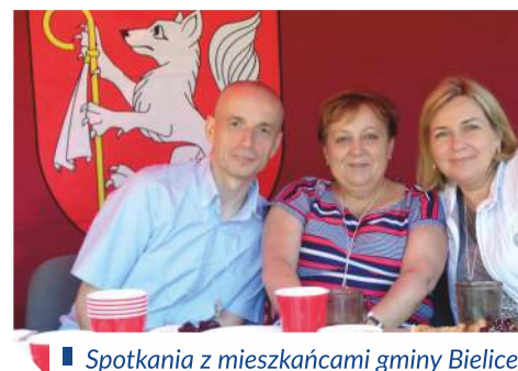
Spotkania z mieszkańcami gminy Bielice

Informator Poselski posła Rafała Muchy za okres czerwiec - lipiec 2019 r. przygotowano staraniem biura poselskiego. W opisywanym okresie biuro rozpoczęło działalność w następujących lokalizacjach: