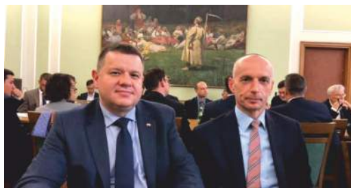
■ Posiedzenie Parlamentarne Zespołu Górnictwa i Energii