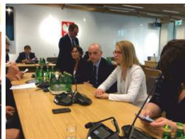
■ Kolejny dzień pracy w Sejmie

- transformacja energetyki w horyzoncie 2050