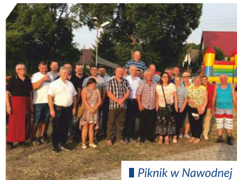
Piknik w Nawodnej