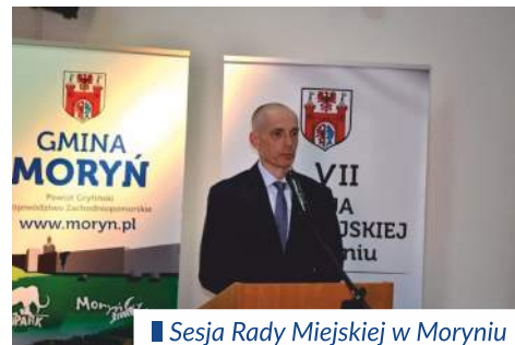
Sesja Rady Miejskiej w Moryniu